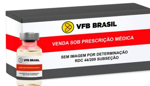
VITAMINA C INJETAVEL 100MG/ML (5ML)