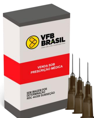
AGULHA HIPODERMICA C100 UNIDADE (16G/18G/20G/22G/24G)