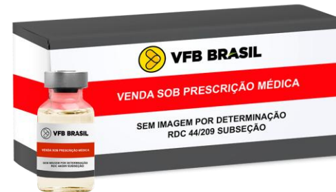
COMPLEXO B SOL. INJ IM/IV AMP (2ML)