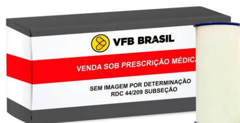
ESPARADRAPO IMPERMEAVEL (10CMX4,5M)