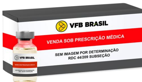
CEFTRIAXONA PO INJ 1G INJ IV CX/100