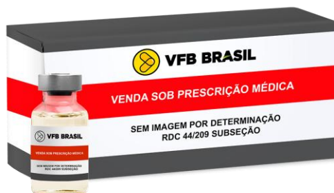
ENOXOPARINA 60MG/0,6ML SOL. INJ