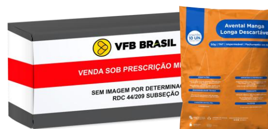
AVENTAL TNT CAPOTE (40G)