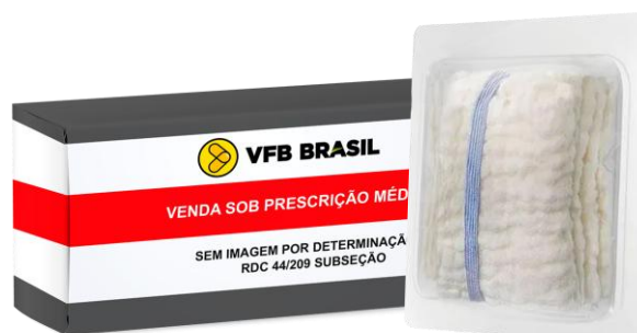
CAMPO OPERATÓRIO (.25 X 28 RX 13G PACT. C/5 PCT)