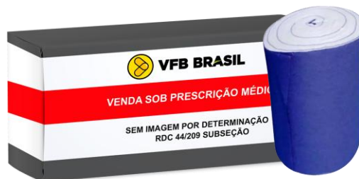
ALGODAO HIDROFILO (500G)