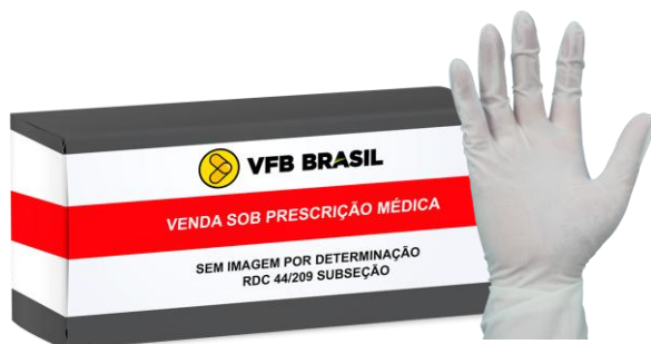
LUVA CIRURGICA ESTERIL C/ PO TAM 6,5/7,0/7,5/8,0/8,5