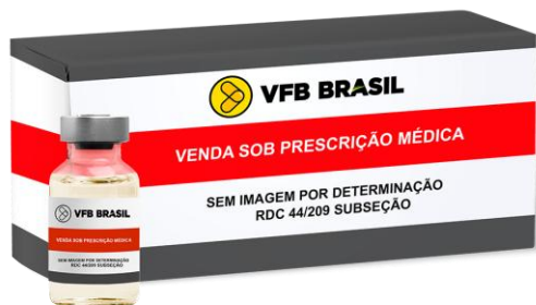
ONDANSETRONA DI-HIDR 2MG/ML (4ML)