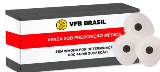
ELETRODO P/MONIT CARDIACO ADULTO E PEDIATRICO