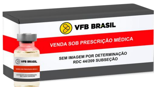
ZEMPLAR 5MCG/ML 5MCG/ML CX C/5 AMP 1ML (PARICALCITOL) (R) ABBVIE