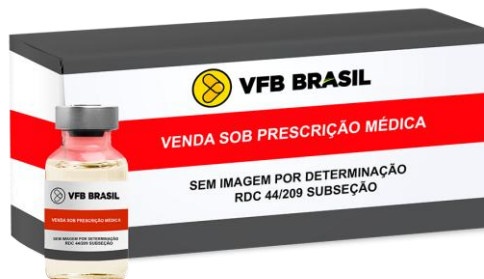
BENZILPENICILINA 1.200.000UI INJ PO INJ