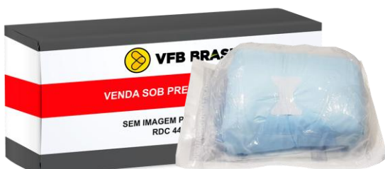
COMPRESSAS DE CAMPO OPERATORIO (45X50 C/ 50)