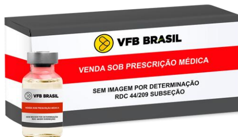
MEROPENEM TIG PO SOLUÇÃO INJETAVEL IV FRASCO