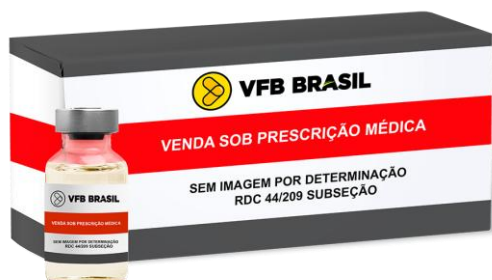
DIPIRONA MONOIDRATADA 1G IV/IM (2ML)